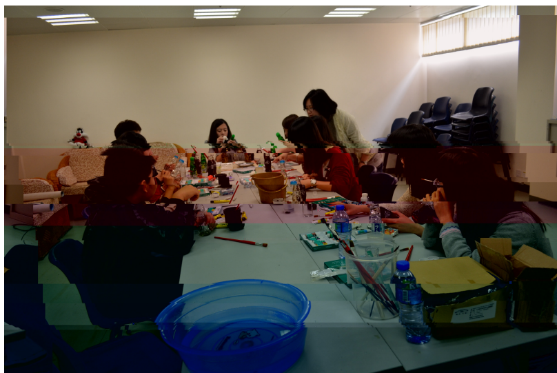
老師正在講解如何手繪玻璃

活動結束後，採訪了幾位同學，他們都表示非常喜歡這個活動，一位同學表示這個活動非常好，如果明年還有活動一定再次參加，另一位同學表示，平時都在忙學習，很少自己去做一些手工製品。這個活動讓她把自己的創意變成一個非常漂亮的工藝品。